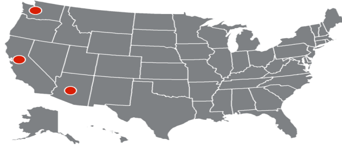
Figure 2: On the Ground Due Diligence Prior to COVID-19

Phoenix Knight Transport Republic Services Sprouts Farmers Market Swift Transport